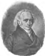
Christoph Wilhelm Hufeland.

Als Begründer der modernen Toxikologie und einer neuen Aera der gerichtlichen Medizin ist M. J. B. Orfila zu betrachten (1787 bis 1853). Seine beiden Hauptschriften sind der «Traité J. P. Franks, ein tüchtiger Anatom und Physiolog, der auch am Krankenbette der objektiven Beobachtung und Untersuchung huldigte. Der Name «Abdominaltyphus» stammt von ihm. Sein «Handbuch der speziellen Nosologie und Therapie» (1831—1836, 2 Bände) war sehr beliebt. Wohl der erstaunlichste